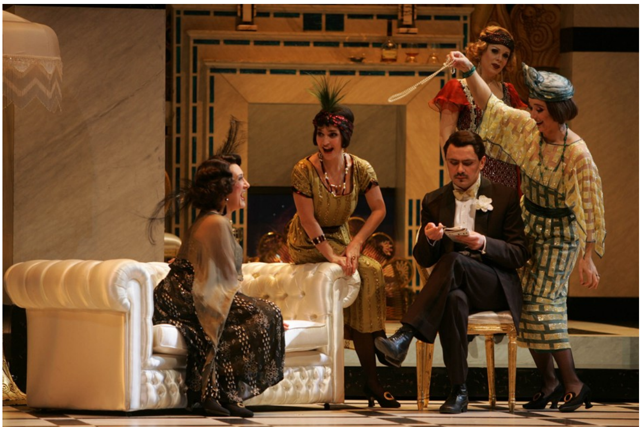
La Rondine - Théâtre du Capitole, 2005