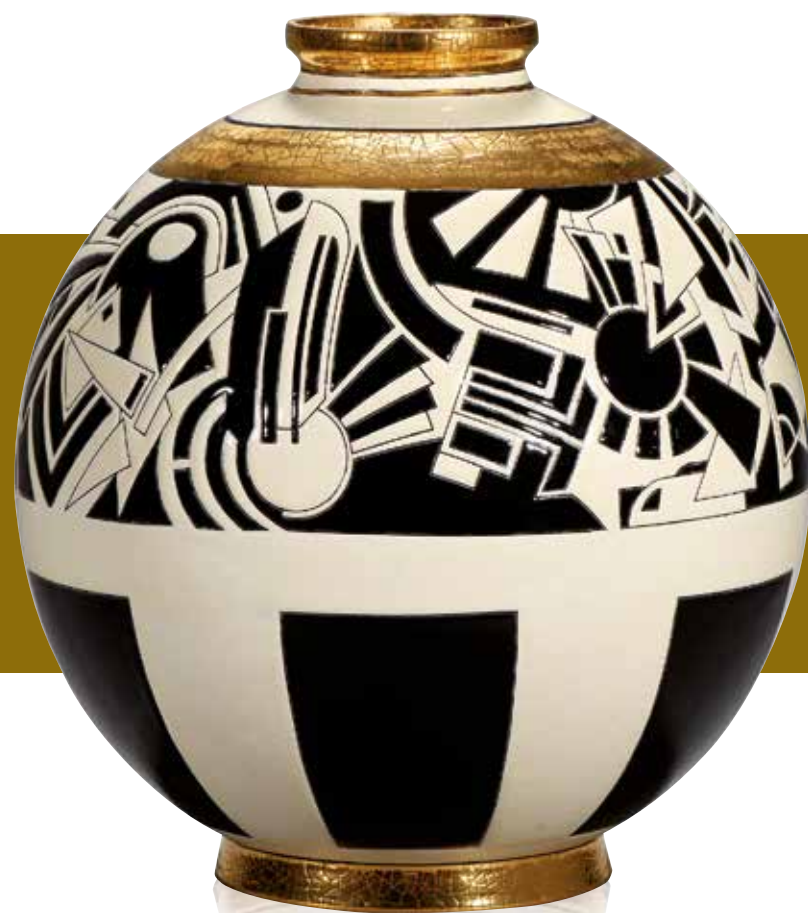
MOTIFS Boule Coloniale Nicolas Blandin