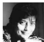
FRANCA SQUARCIAPINO Costumes