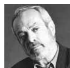
EZIO FRIGERIO Décors