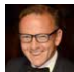
STEPHEN BARLOW Réalisation de la mise en scène