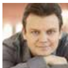
DMYTRO POPOV Ténor Ruggero