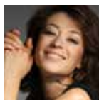
ELENA GALITSKAYA Soprano Lisette