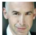
VINCENT ORDONNEAU Ténor Gobin