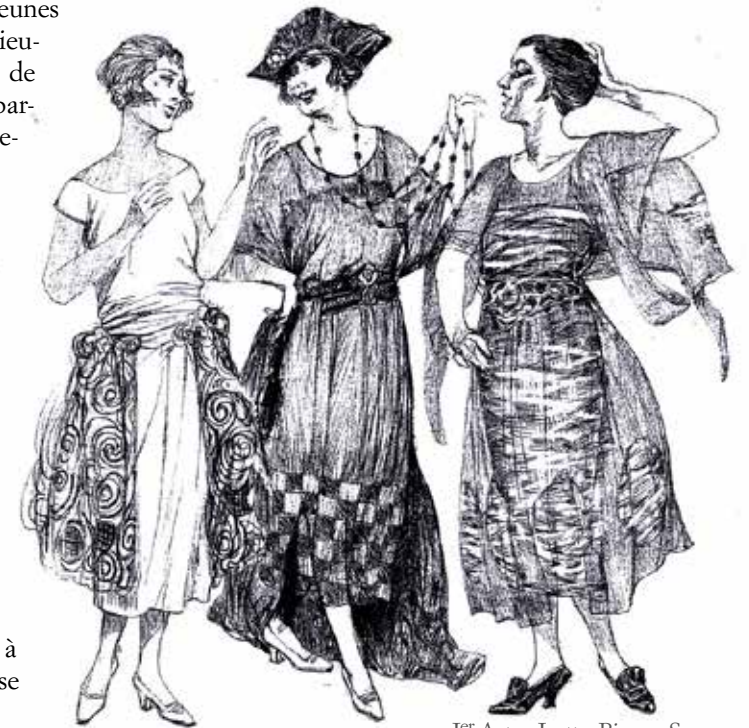
1 er Acte - Ivette, Bianca, Suzy Dessins des costumes de la production (c) Franca Squarciapino

Il faut pour La Rondine un couple de chanteurs lyriques, typiques de Puccini, mais qui ne peuvent pas ne pas être comédiens ; il y a aussi le couple comique, mais qui se retrouve sans cesse dans des situations dangereuses. Le quiproquo du deuxième acte n'a rien de drôle.