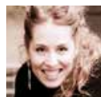
ROMIE ESTEVES Mezzo-soprano Suzy