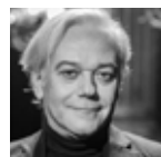
PAOLO ARRIVABENI Direction musicale